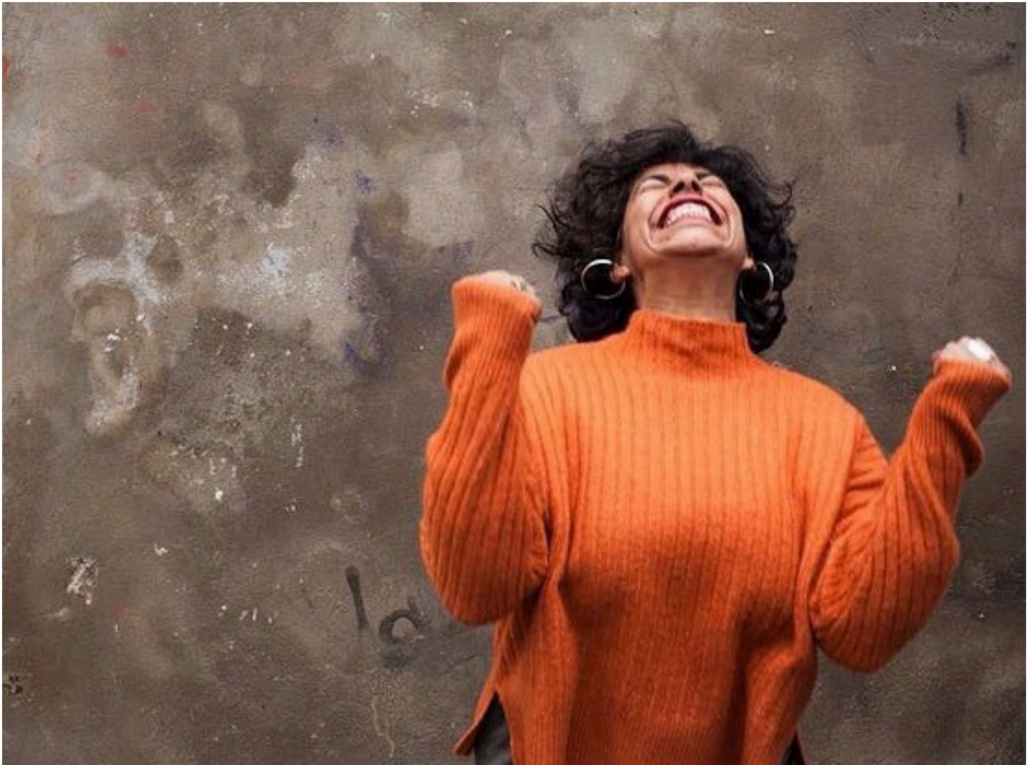
Oeuvre de Morgane Visconti